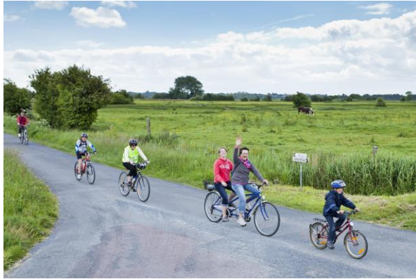
Randonnées à vélo