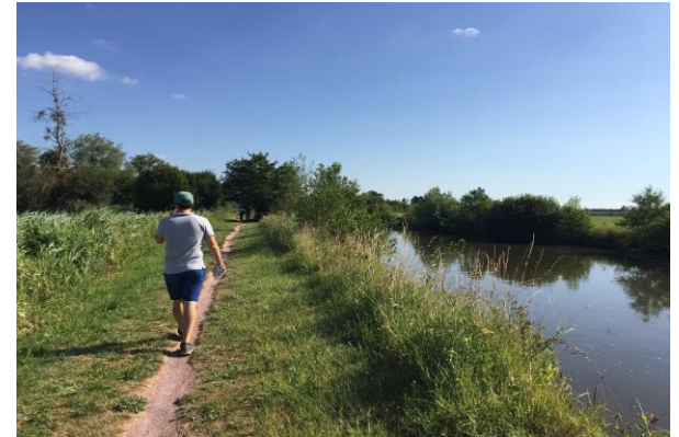
Randonnées à pied